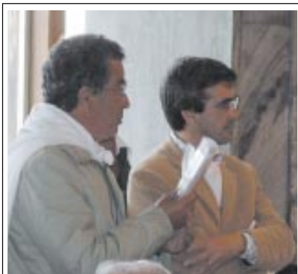
30 de Abril de 2003 - Entrega na Câmara de uma petição com mais de 2000 assinaturas de avenses.

das sugestões ao estudo prévio e foi uma das conclusões do processo de discussão pública do projecto.