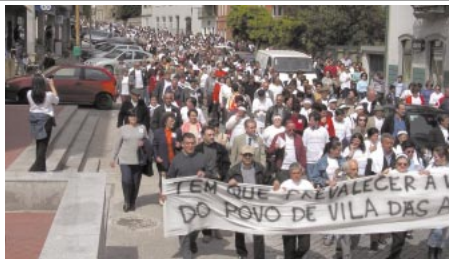
1 de Maio de 2003 - O povo de Vila das Aves empenhou-se activamente em prol desta causa.

A não concretização dessas decisões viola o processo legal e desrespeita a concordância unânime de que foi objecto, pelas partes com legitimidade para o efeito.